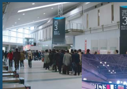
受付前には長打の列が！