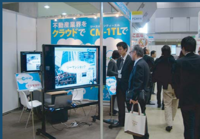
CM-1TLの映像にひかれて、多くのお客様がブースに来場されました。