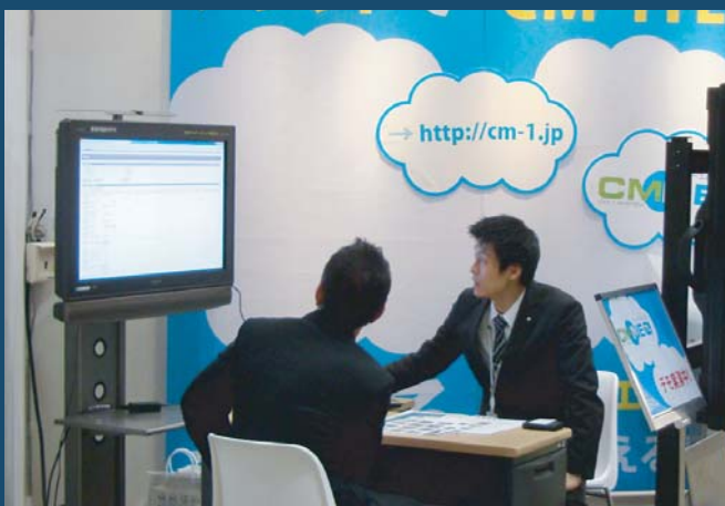
ブースではデモを実演！

弊社ブースではテナントリーシングシステム「CM-1TL」（シーエムワンティール）をご紹介します。